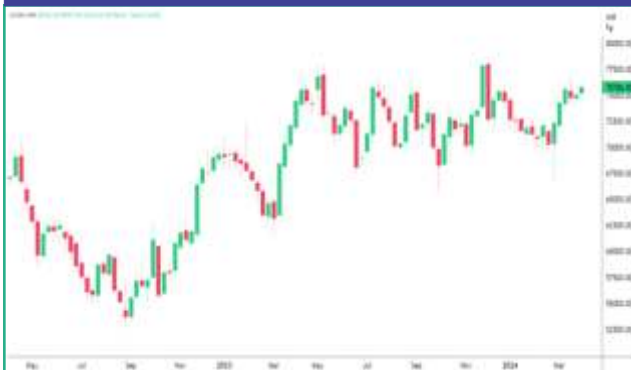
एमसीएक्स में चांदी की कीमतों में साप्ताहिक बदलाव