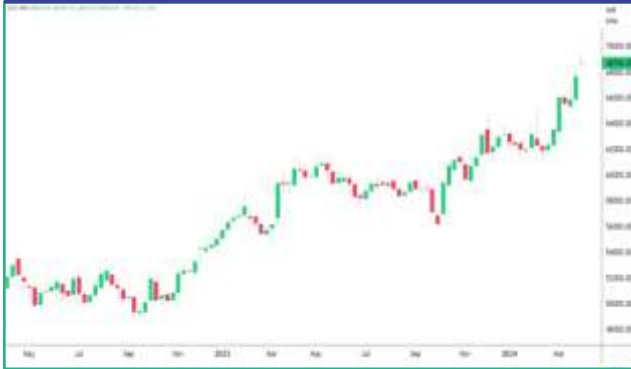
एमसीएक्स में सोने की कीमतों में साप्ताहिक बदलाव