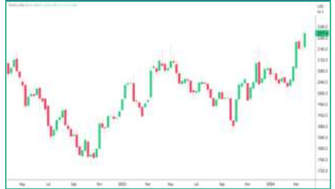
कोमेक्स में सोने की कीमतों में साप्ताहिक बदलाव