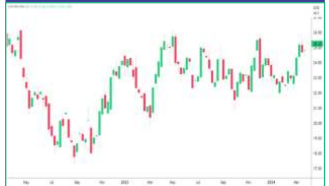
कोमेक्स में चांदी की कीमतों में साप्ताहिक बदलाव